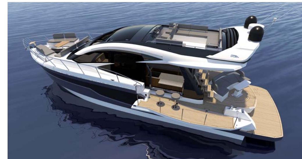
Le Beach Package avec ses pavois rabattables est également disponible

Laissez-vous séduire par les innovations alléchantes et le caractère racé du 510 Skydeck !