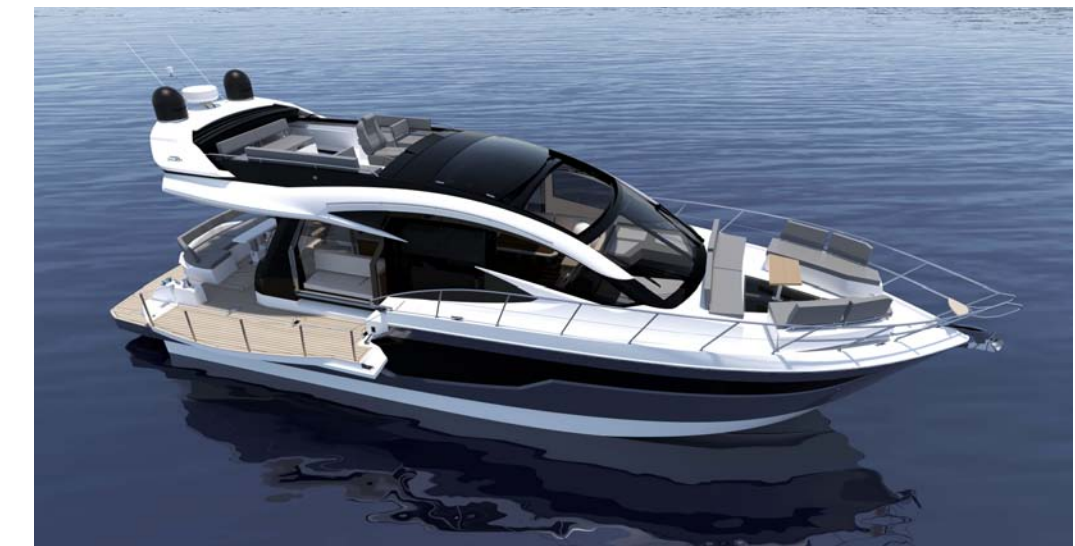
Le Skydeck combine un flybridge compact et un hard-top en verre